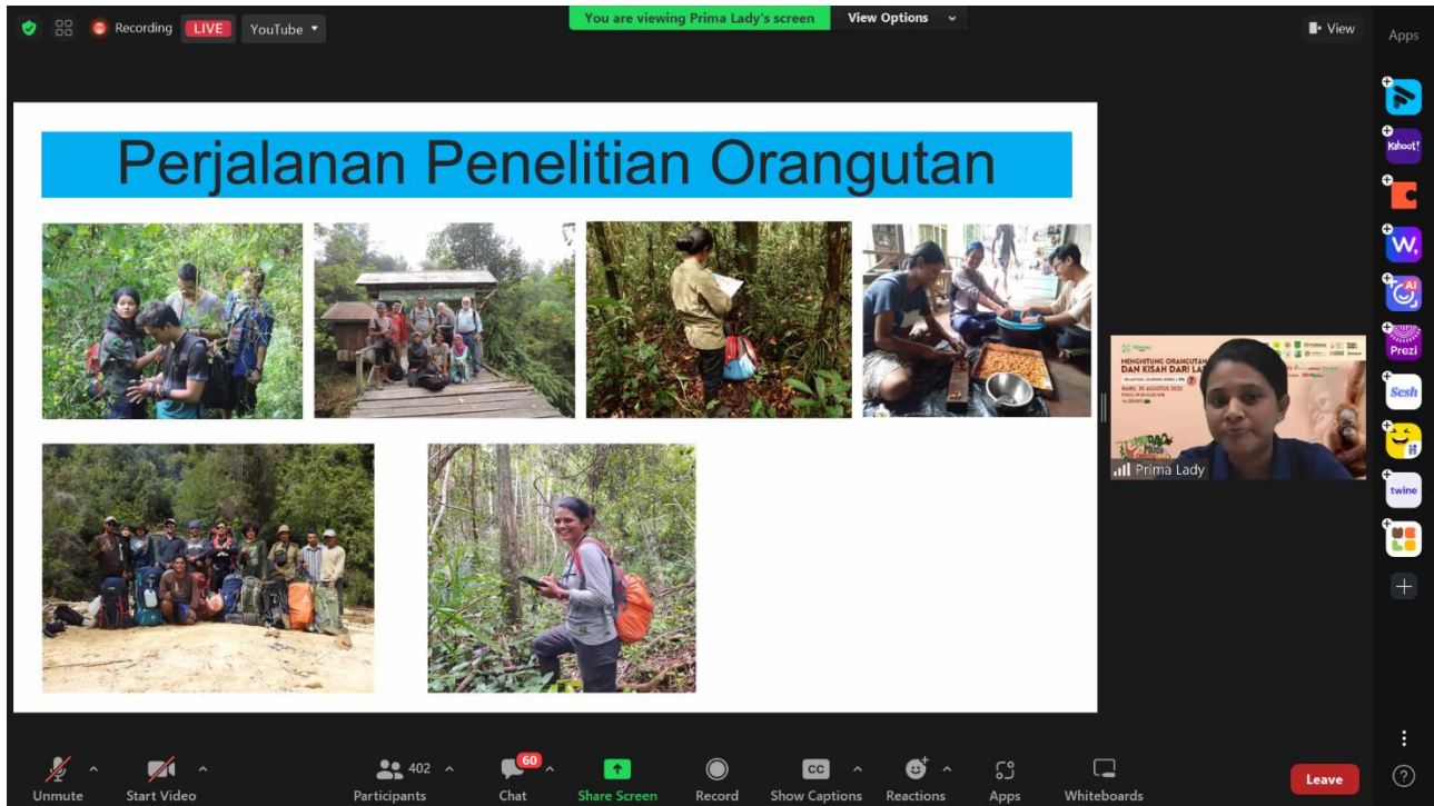
[Narsumber 3 : Prima Lady]